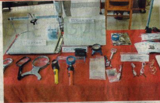
शिवाजी विद्यापीठात साकारलेल्या समावेशी शिक्षण संसाधन केंद्रामध्ये दिव्यांग विद्यार्थ्यांसाठी अद्यावत तंत्रज्ञानावरील साधने उपलब्ध आहेत.

खड्डेकर ग्रंथालयात कार्यान्वित आहे. या ब्रेल लायब्ररीमध्ये जास्तीत जास्त अद्यावत आणि अन्य दिव्यांग विद्यार्थ्यांकरिता आवश्यक साधने,