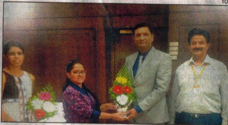
Two SUK students got scholarships to study in foreign universities

These mock entrance tests are most essential for engineering and medical aspirants.